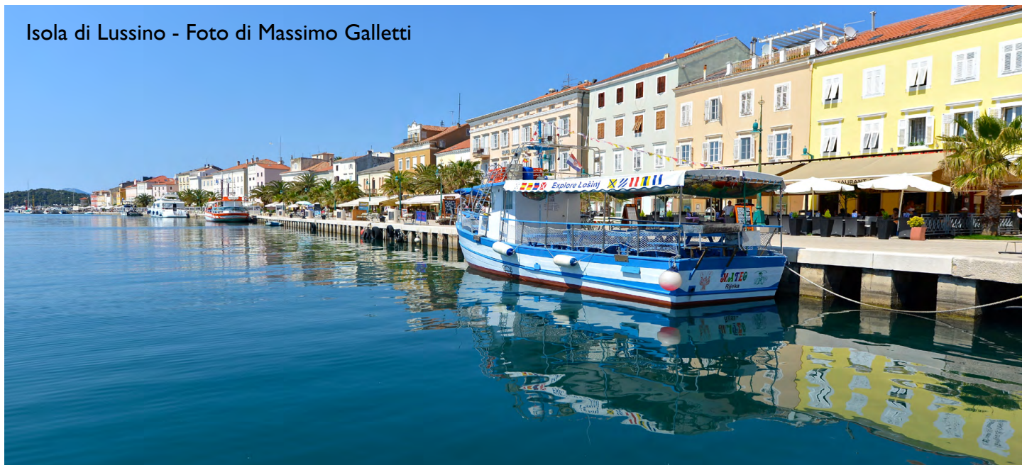
Isola di Lussino - Foto di Massimo Galletti

*Servizio navetta dalle altre città in catalogo pag. 6 - € 20,00 p.p.