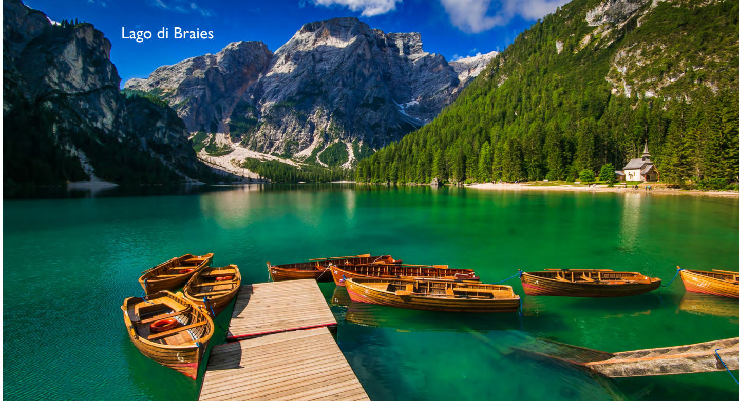
Lago di Braies